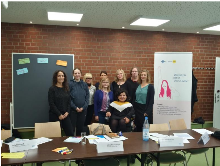
Empowert: Teilnehmer*innen der Frauen-Zukunftswerkstatt

am 27. September 2019 im Jugendgästehaus Hauptbahnhof Berlin, Lehrter Straße 68, 10557 Berlin